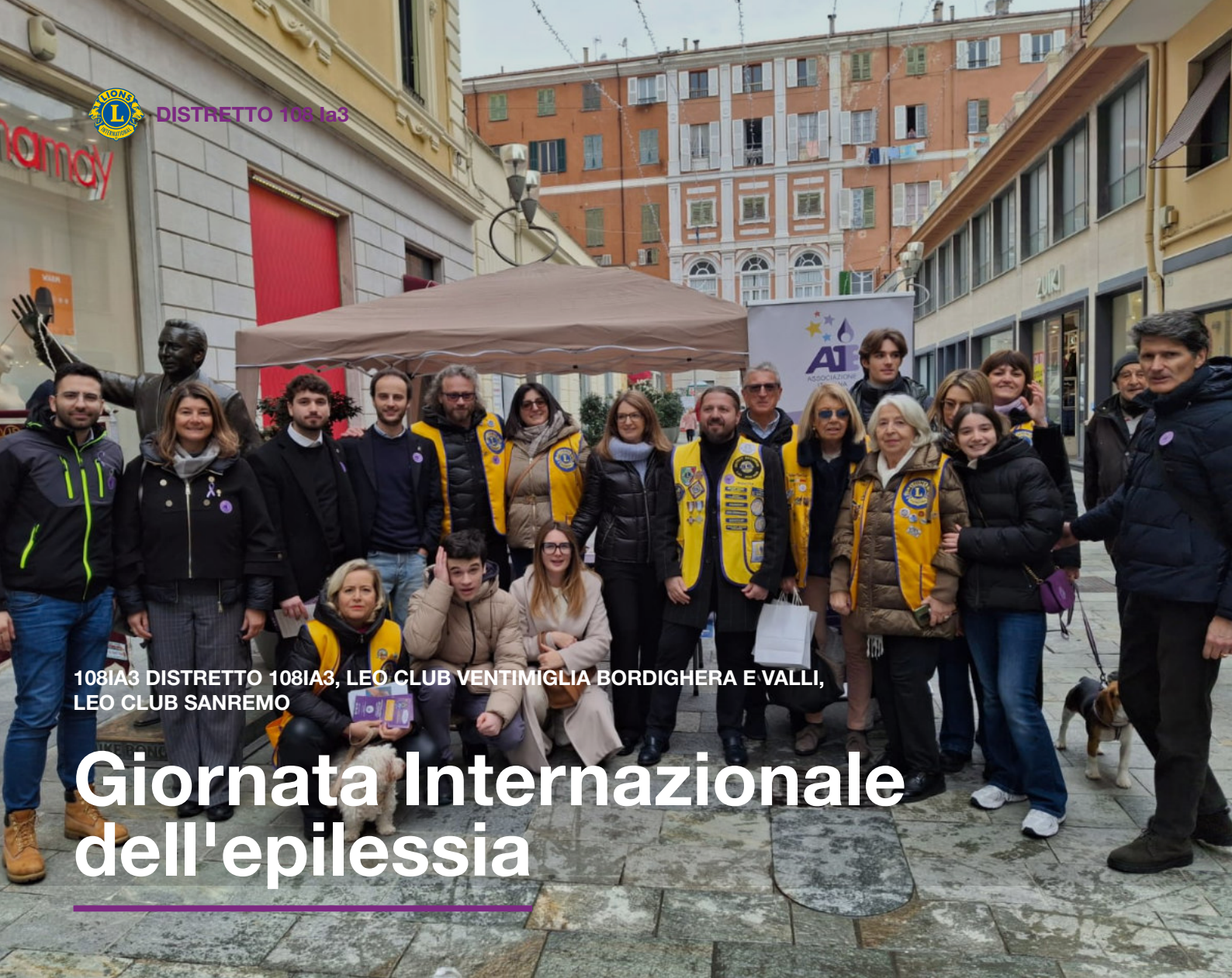
108IA3 DISTRETTO 108IA3, LEO CLUB VENTIMIGLIA BORDIGHERA E VALLI, LEO CLUB SANREMO